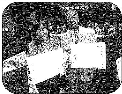
今年中に900人は必達目標！？