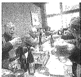
今年はどこへ行く？